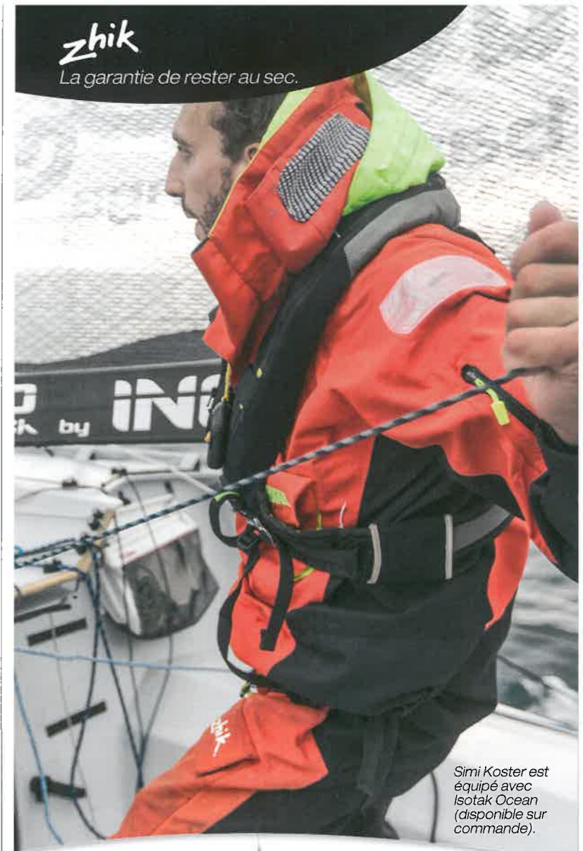
Simi Koster est équipé avec Isotak Ocean (disponible sur commande).

Etanche, respirant, performant et résistant.